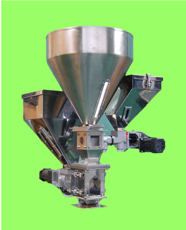
主材、粉碎材、副材混合