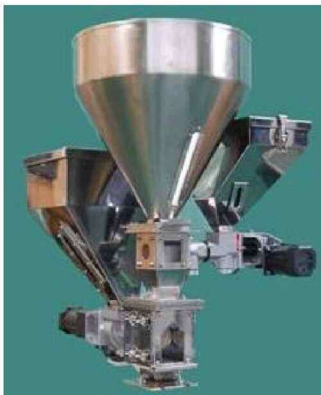
画像は3種混合フィーダーです。